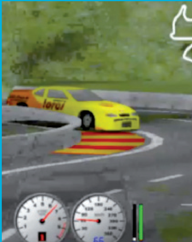
Conducción automática de vehículos

El Grupo de Redes de Neuronas y Computación Evolutiva en Inteligencia Artificial (EVANNAI), liderado por el doctor Pedro Isasi Viñuela, está integrado por un equipo humano que lleva a cabo investigación básica y aplicada en los campos de la computación biológica y el aprendizaje automático/minería de datos. El grupo utiliza técnicas de computación biológica (algoritmos genéticos, estrategias evolutivas, enjambres de partículas, ...) para resolver problemas de optimización y para abordar tareas típicas de minería de datos, tales como clasificación, predicción de series temporales, agrupación (clustering), selección de variables relevantes, etc.